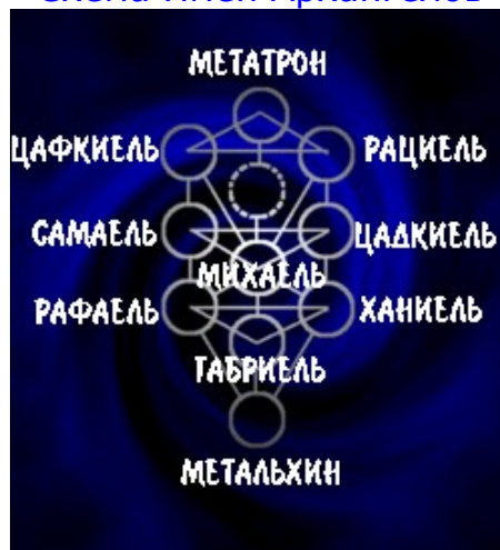
Схема Имен Архангелов

Миру Брия соответствуют 10 Имен Архангелов