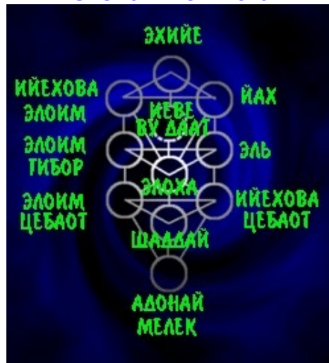
Схема Имен Бога

Миру Брия соответствуют 10 Имен Архангелов