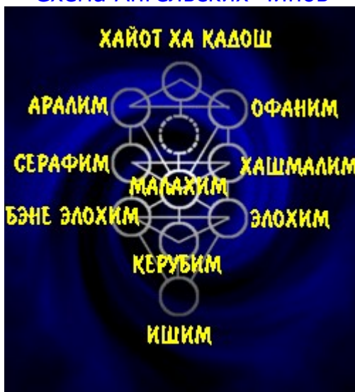
Схема Ангельских Чинов

Миру Иецира соответствуют 10 чинов ангельских